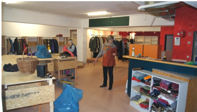
Kleiderkammer im ehemaligen Buchcafé

Als im vergangenen November ca. 700 Helfer den Herkulesmarkt in Bad Hersfeld für zu erwartende Flüchtlinge vorwiegend aus Syrien als Notunterkunft herrichteten, war uns allen - auch den IkuZlern - vollkommen unklar, wie wir damit umgehen könnten. Welche Betreuung können wir anbieten, wer spricht Arabisch und kann dolmetschen, welche