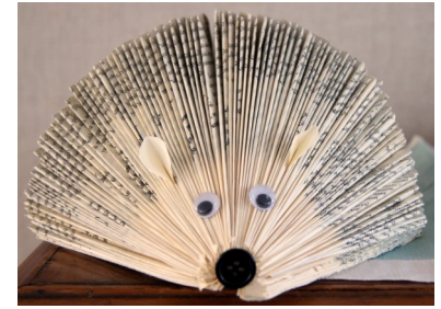
Unser Maskottchen zum Tag des Buches