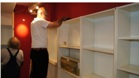
Kleiderkammer in der Entstehungsphase