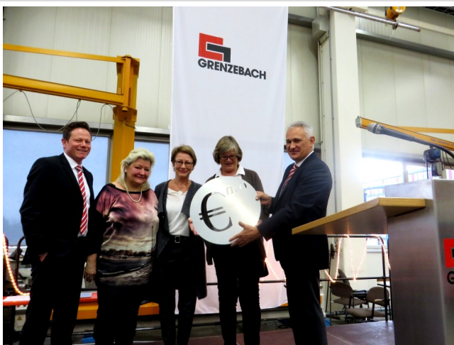
Spendenübergabe bei Fa. Grenzbach

Wir freuen uns, dass die Arbeit des IkuZ durch zahlreiche Spender gewürdigt wird. Neben den vielen kleinen Spenden, die während der Öffnung des Begegnungsraumes den Weg in die Spendenkasse fanden, ergaben sich aber auch größere, die wir für die Unterhaltung des Begegnungsraums und die notwendigen Ausgaben im Zusammenhang mit der Arbeit mit Migranten benötigen. Besonders danken möchten wir der Bäckerei Jäger, die uns jeden Samstag mit überzähligem frischem Gebäck und Brot versorgt. Hinzu kamen 2015 und 2016 Spenden des Landkreises Hersfeld-Rotenburg, der Stadt Bad Hersfeld, der Fa. Grenzbach, des Rotary Clubs, der Stadtkirche, der Sparkasse Hersfeld-Rotenburg und der Kommunität Imshausen.